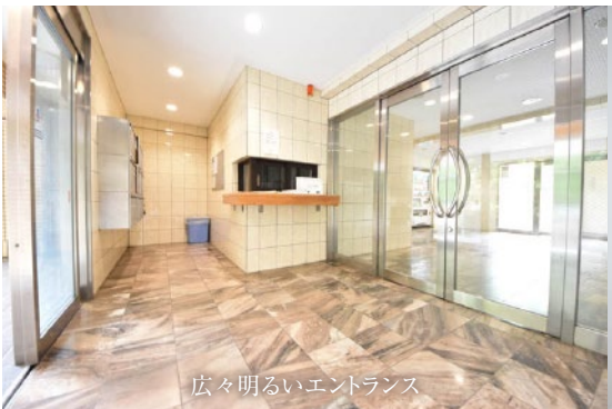
広々明るいエントランス