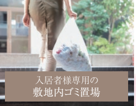
入居者様専用の 敷地内ゴミ置場

バイク・自転車置場完備 バイク置場 月額3,300円(税込) 自転車置場 登録料5,500円(税込)