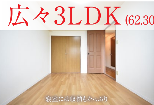
寝室には収納もたっぷり