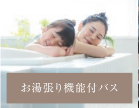
お湯張り機能付バス