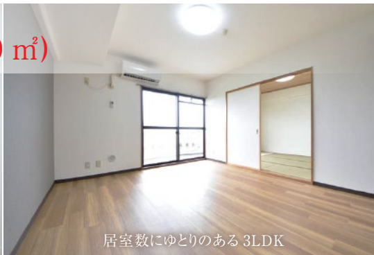
居室数にゆとりのある3LDK