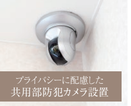
プライバシーに配慮した 共用部防犯カメラ設置