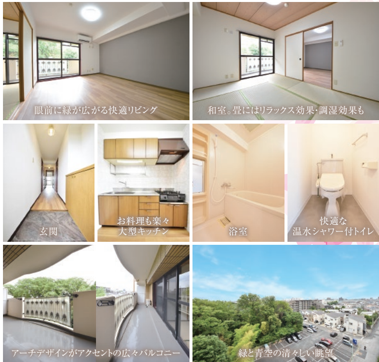
眼前に緑が広がる快適リビング