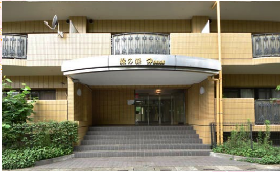
総タイル張りの重厚感あるフォルム