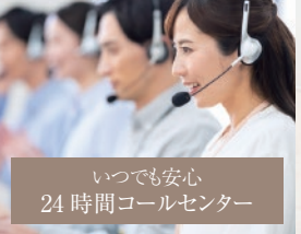
いつでも安心 24時間コールセンター