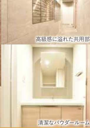
清潔なパウダールーム

春のお引越し応援キャンペーン中 ※1 敷金 0 ヶ月・礼金 0 ヶ月・無料 2 ヶ月 共益費含む