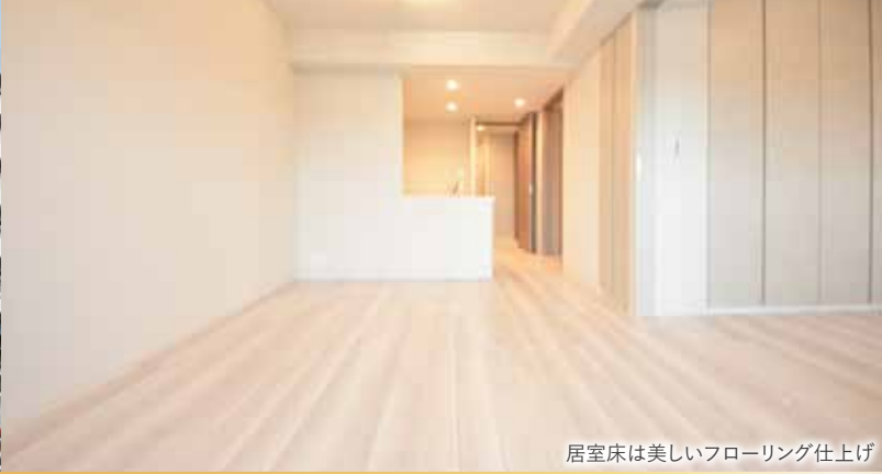
居室床は美しいフローリング仕上げ