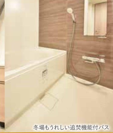
冬場もうれしい追い焚き機能付バス