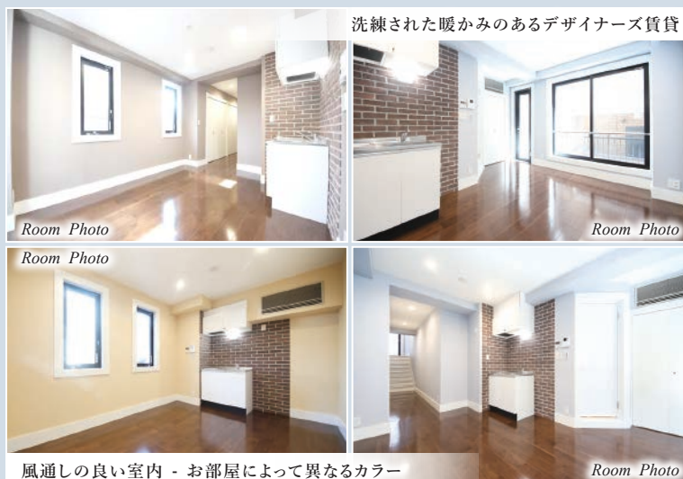
洗練された暖かみのあるデザイナーズ賃貸