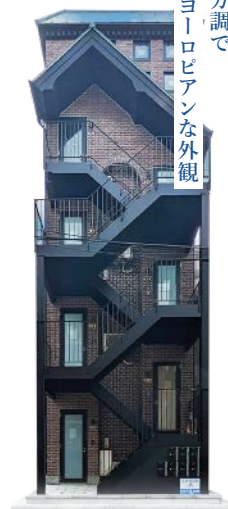
レンガ調で ヨーロッパな外観