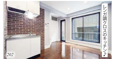
レンガ調クロスのキッチン