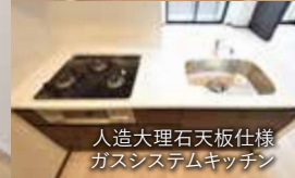
人造大理石天板仕様 ガスシステムキッチン