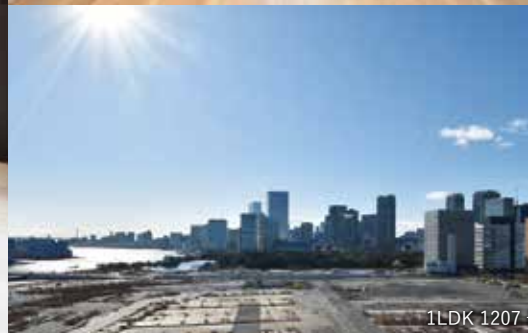
1LDK 1207号室より撮影 ※景色は永続的に保証できるものではありません