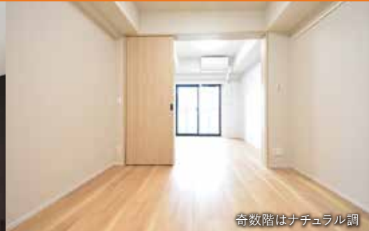
奇数階はナチュラル調