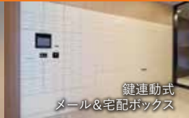
鍵連動式 メール&宅配ボックス