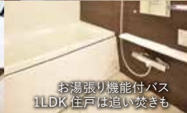
お湯張り機能付バス 1LDK 住戸は追い焚きも