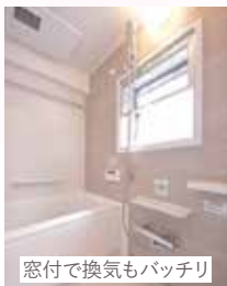
窓付で換気もバッチリ