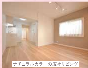
ナチュラルカラーの広タリビング