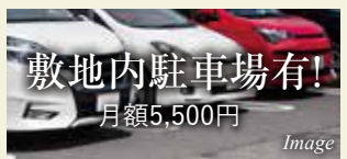
※諸条件含め空要確認