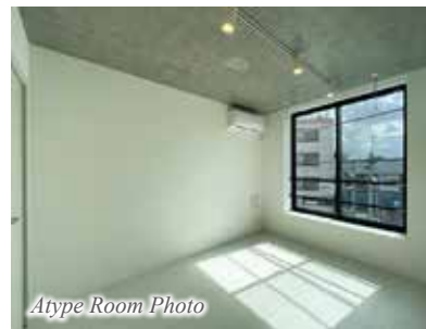
Atype Room Photo