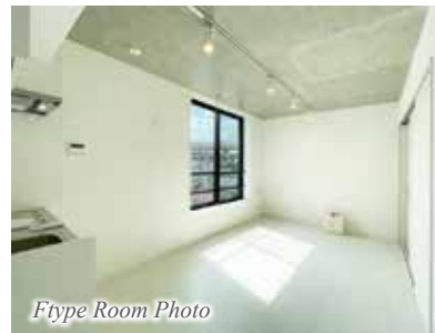
Ftype Room Photo