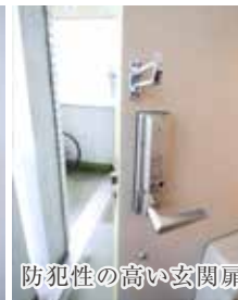
防犯性の高い玄関扉