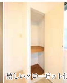
嬉しいクローゼット付