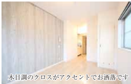
木目調のクロスがアクセントでお洒落です