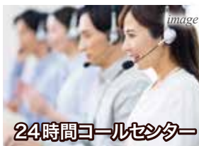
24時間コールセンター