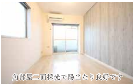
角部屋二面採光で陽当たり良好です