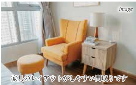
家具のレイアウトがしやすい間取りです