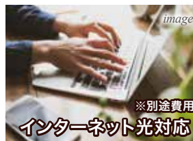
※別途費用 インターネット光対応