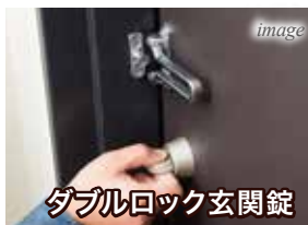
ダブルロック玄関錠