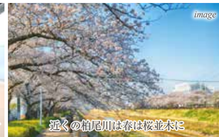
近くの粕尾川は春は桜並木に

※共益費 5,000円 ※図面と現況が異なる場合、現況優先とさせていただきます。