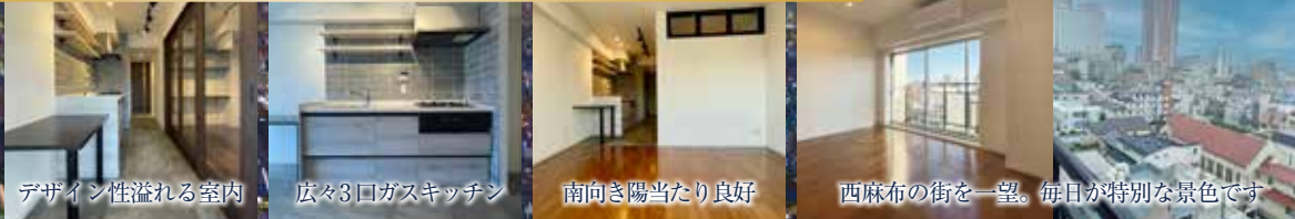
デザイン性溢れる室内 広々3口ガスキッチン 南向き陽当たり良好 西麻布の街を一望。毎日が特別な景色です