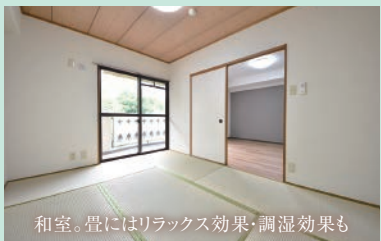
和室。畳にはリラックス効果、調湿効果も