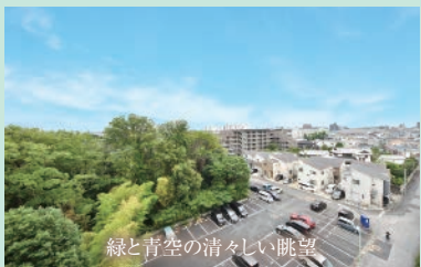
緑と青空の清々しい眺望