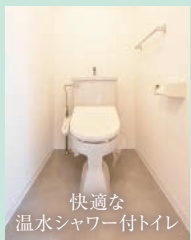
快適な 温水シャワー付トイレ