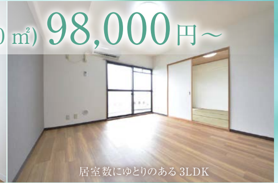
居室数にゆとりのある3LDK