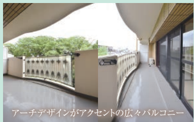
アーチデザインがアクセントの広々バルコニー