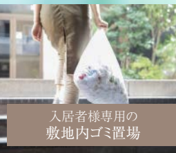
入居者様専用の 敷地内ゴミ置場

バイク・自転車置場完備 バイク置場 月額3,300円(税込) 自転車置場 登録料5,500円(税込)