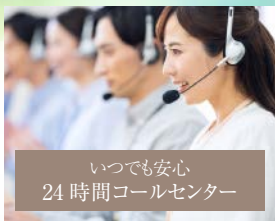
いつでも安心 24時間コールセンター