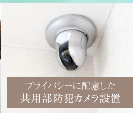
プライバシーに配慮した 共用部防犯カメラ設置