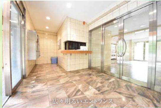
広々明るいエントランス