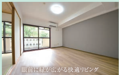
眼前に緑が広がる快適リビング