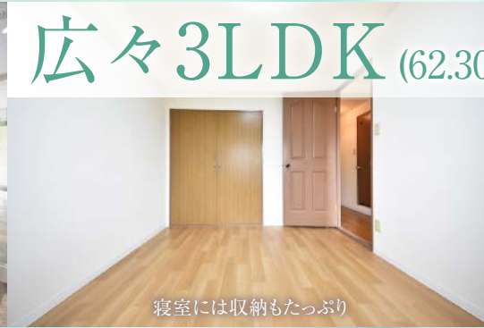
寝室には収納もたっぷり