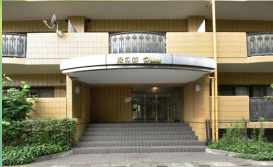
総タイル張りの重厚感あるフォルム