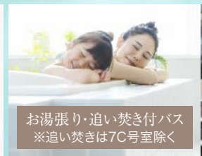
お湯張り・追い焚き付バス ※追い焚きは7C号室除く