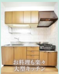
お料理も楽々 大型キッチン