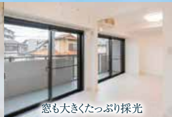
窓も大きかったぶり採光