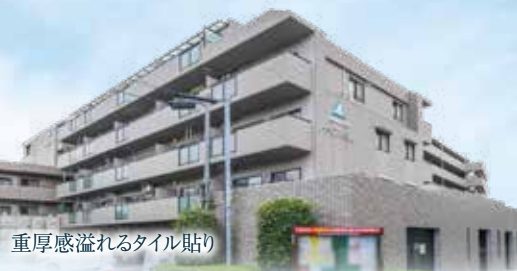
重厚感溢れるタイル貼り