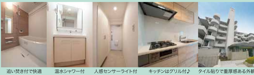
追い焚き付で快適 温水シャワー付 人感センサーライト付 キッチンがグリル付♪ タイル貼りで重厚感ある外観