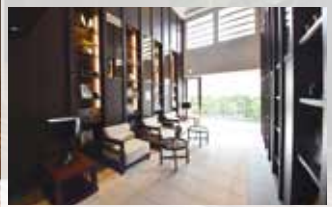
共用部にはくつろぎのラウンジ