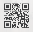
当物件の 写真公開中!