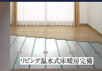
リビング温水式床暖房完備