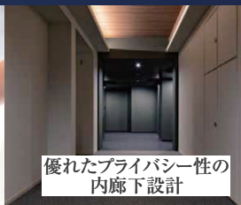
優れたプライバシー性の 内廊下設計