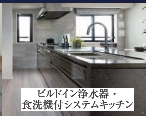
ビルドイン浄水器・ 食洗機付システムキッチン