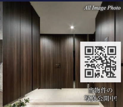
All Image Photo