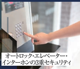
オートロック・エレベーター・ インターホンの3重セキュリティ