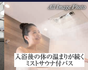
入浴後の体の温まりが続く ミストサウナ付バス