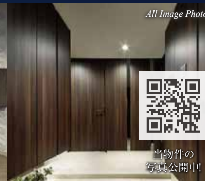
All Image Photo