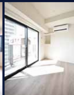
All Image Photo