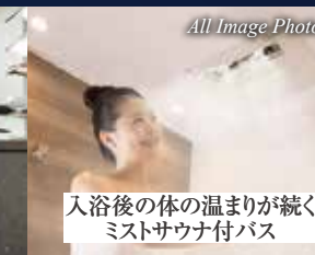
入浴後の体の温まりが続く ミストサウナ付バス