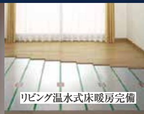
リビング温水式床暖房完備