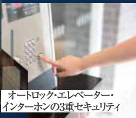
オートロック・エレベーター・ インターホンの3重セキュリティ