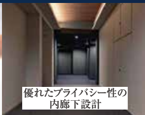
優れたプライバシー性の 内廊下設計