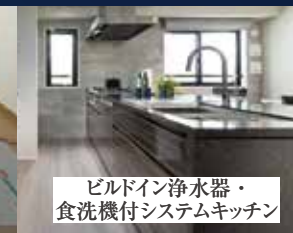
ビルドイン浄水器・ 食洗機付システムキッチン