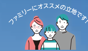
Image 狛江市は、多摩川河岸や武蔵野の自然と交通の便利さの両方で知られる街です。都心への通勤・通学が非常に便利。一方、治安は比較的良好、ファミリーも住みやすい街です。当物件は小田急小田原線「喜多見」駅と「狛江」駅までのアクセスがよく、駅にはカフェや飲食店も多数あるため、生活も充実です。