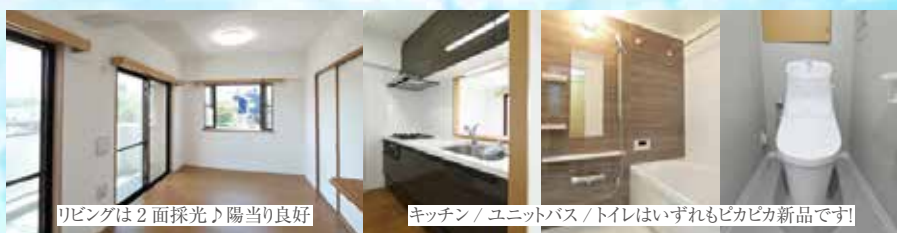
リビングは2面採光♪陽当たり良好