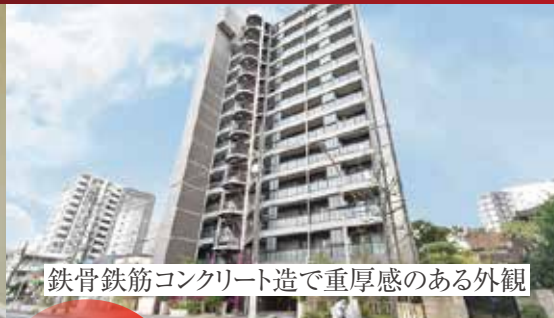
鉄骨鉄筋コンクリート造で重厚感のある外観