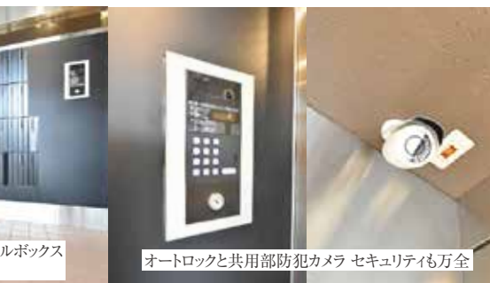
オートロックの内側から取り出せるメールボックス 宅配ボックスも完備♪