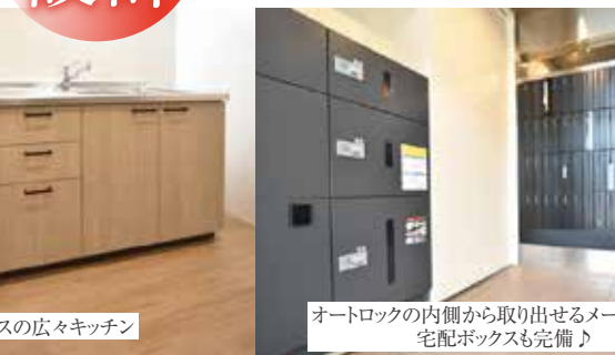
グリル付3口ガスの広々キッチン