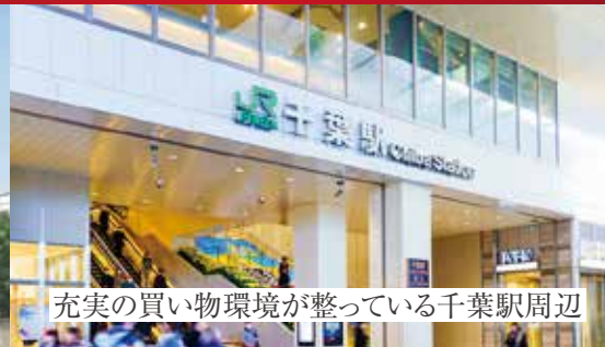
充実の買い物環境が整っている千葉駅周辺