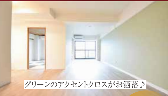
グリーンアクセントクロスがお洒落♪