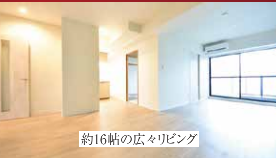
約16帖の広々リビング

まるでリモート内見! 物件紹介ムービー公開中 駅周辺環境やマンション共用部、 お部屋の中もご紹介しています。