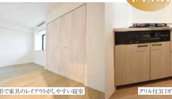
長方形で家具のレイアウトがしやすい寝室