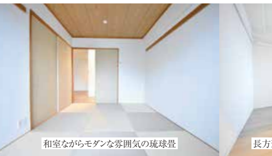
和室ながらモダンな雰囲気な琉球畳