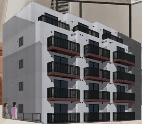
外観完成イメージ