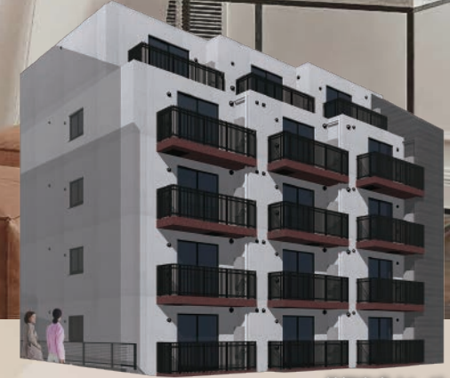
外観完成イメージ