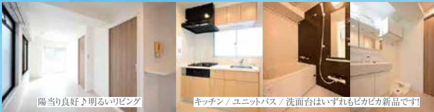
陽当たり良好♪明るいリビング