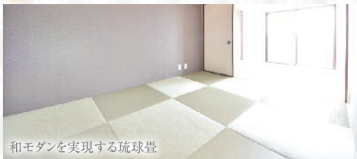
和モダンを実現する琉球畳