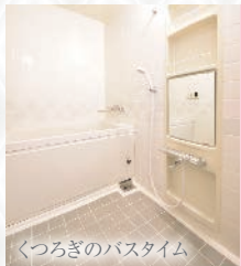
くつろぎのバスタイム