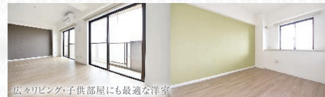
広々リビング・子供部屋にも最適な洋室