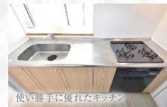
使い勝手に優れたキッチン