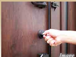
ハイセキュリティ玄関扉