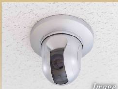
共用部防犯カメラ設置