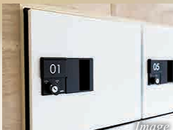
宅配ボックス完備