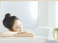
お湯張り・追い焚き 機能付バス