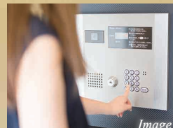
カラーTVモニター付 オートロックシステム

各フロアに1世帯のみの独立設計。全住戸3面採光・南向きで、物件エントランスからお部屋の入口までこだわったマンションです。