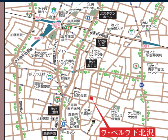
ラ・ペルラ下北沢