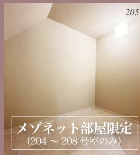
メゾネット部屋限定 (204～208号室のみ)