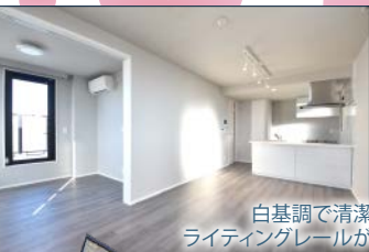
白基調で清潔感のある明るい室内 ライティングレールがスタイリッシュな空間を演出

205～208号室を4月末までに契約締結された方が敷金0ヶ月キャンペーン対象です。