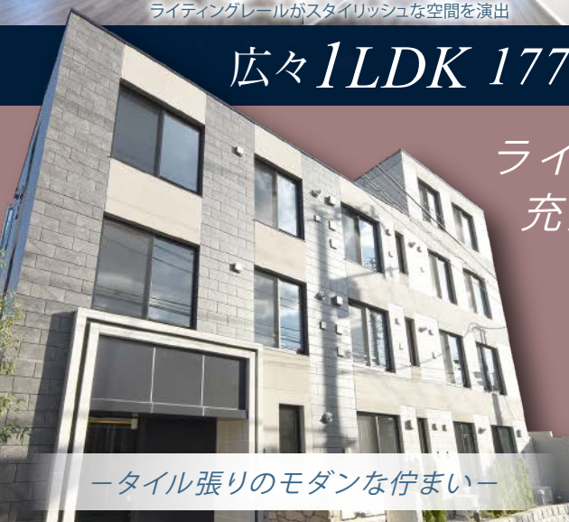
ータイル張りのモダンな佇まいー