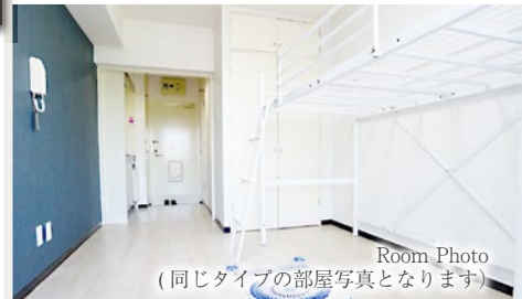
Room Photo (同じタイプの部屋写真となります)