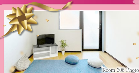
Room 306 Photo