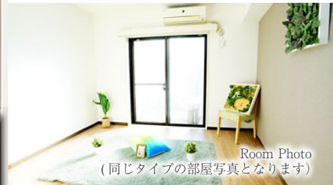
Room Photo (同じタイプの部屋写真となります)