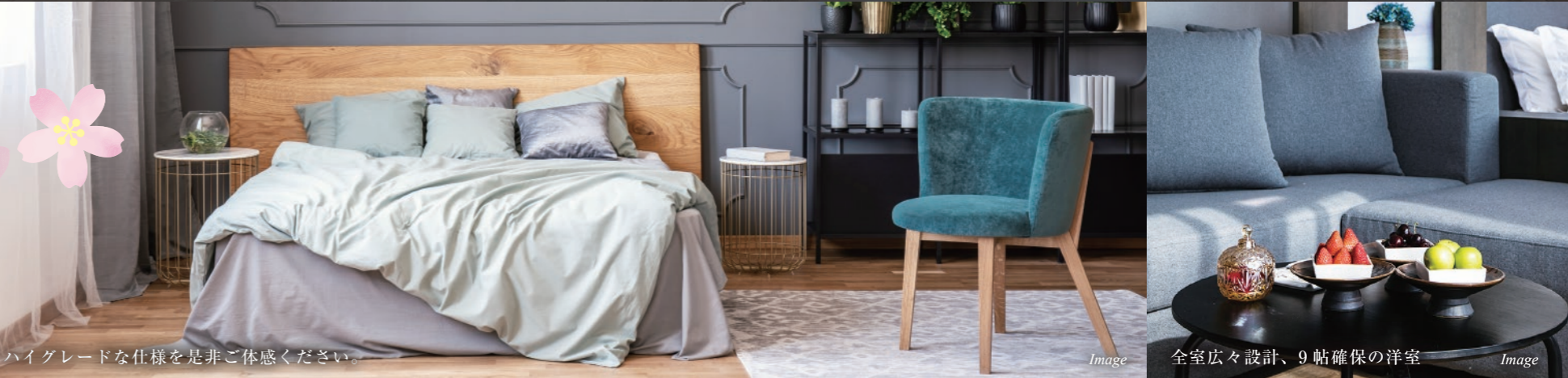
ハイクレードな仕様を是非ご体感ください。

モニター付インターホン/ピッキング対策に優れたディンプルキーを採用/キーチェーンより防犯性の高いドアガード/ダイヤル式メールボックス/敷地内ゴミ置場