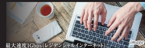
最大速度1Gbps (レジデンシャルインターネット)

テレワークや在宅でお仕事される方に最適。休日のおうち時間も安心して楽しむことができます。手続きの必要もなく入居後すぐに使用をすることができます。 ※Wi-Fiをご利用になるにはご入居様にて事前に機器をご用意いただく必要があります。