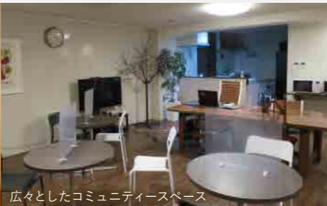
広々としたコミュニティスペース