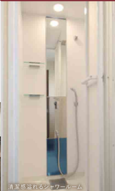
清潔感溢れるシャワールーム