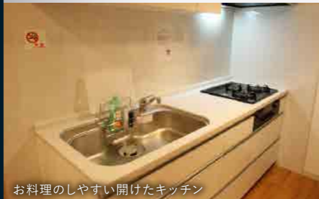
お料理のしやすい開けたキッチン