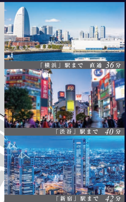
「横浜」駅まで 直通 36分

※所要時間は日中平常時のもので、乗り換え・待ち時間は含まれておりません。また時間帯により異なります。