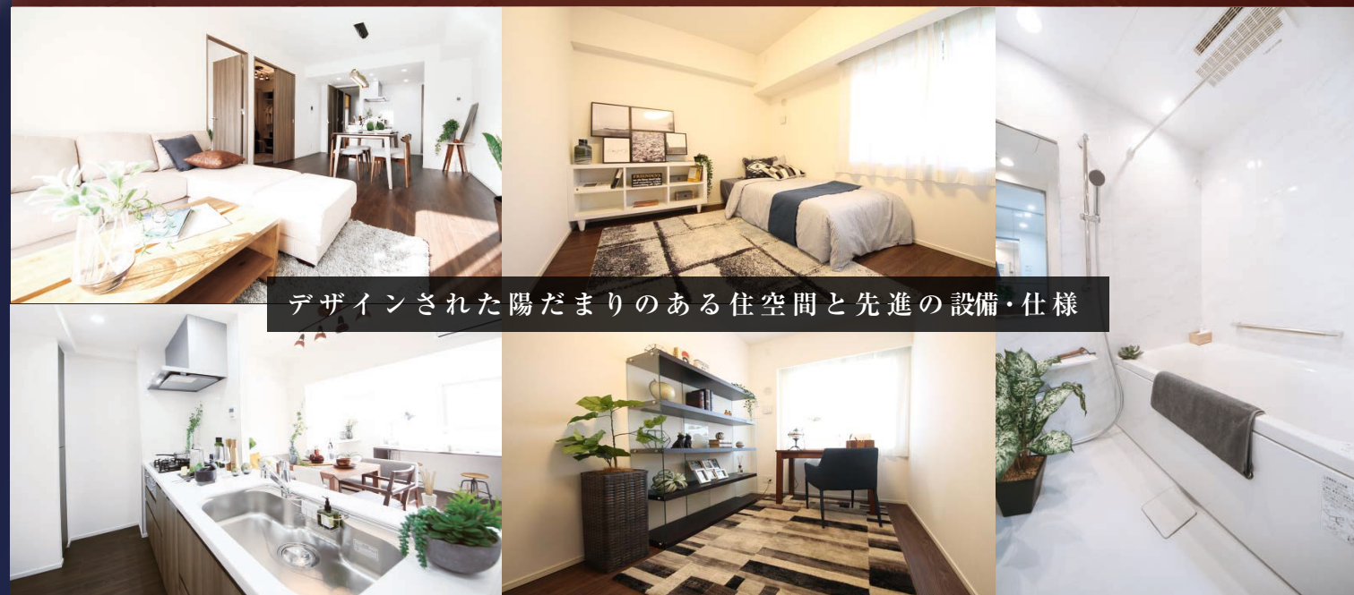
デザインされた陽だまりのある住空間と先進の設備・仕様

住戸内で火災などの異常が発生した場合、住戸内のセキュリティインターホンが警報音を鳴らし、警報表示が点滅、さらに管理室にも警報が届きます。同時に総合警備保障へ自動通報され、迅速かつ的確に対処。状況に応じて関係各所に通報します。