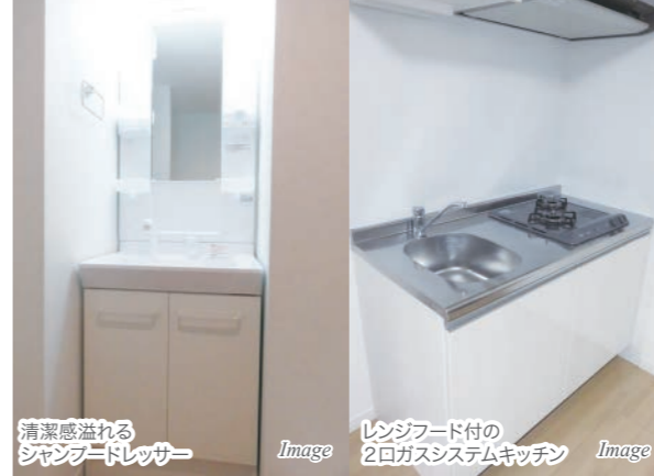
清潔感溢れるシャワートイレ