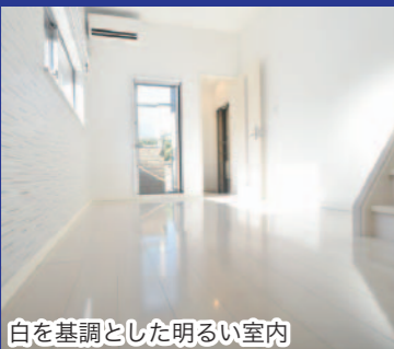
白を基調とした明るい室内