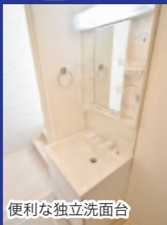
便利な独立洗面台