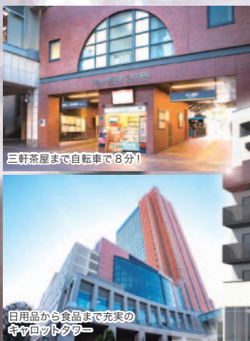
三軒茶屋まで自転車で8分!

●未内見契約になります。新築ですので問題はないと思いますが、入居時に設 備の故障や不具合がございましたら、当方にて全てご対応させていただきます。