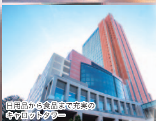
日用品から食品まで充実の キッチン&収納