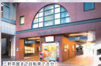
三軒茶屋まで自転車で8分!

●未内見契約になります。新築ですので問題はないと思いますが、入居時に設 備の故障や不具合がございましたら、当方にて全てご対応させていただきます。