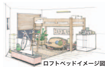
ロフトベッドイメージ図