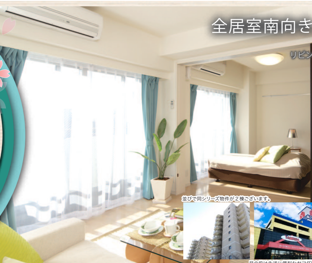
並びで同シリーズ物件が2棟ございます。