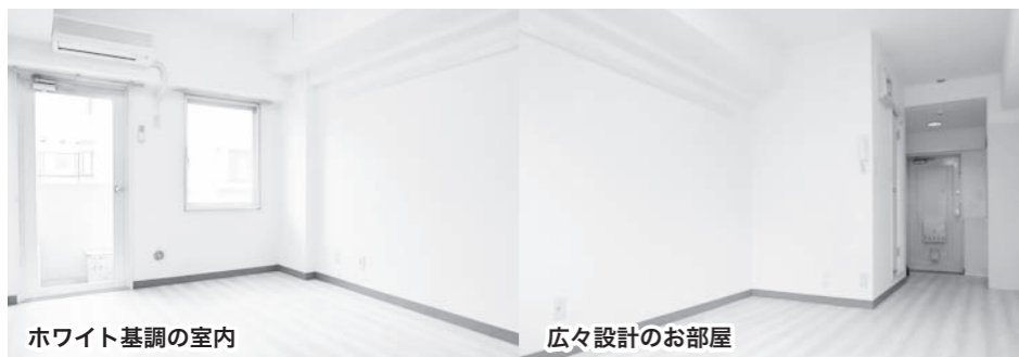
ホワイト基調の室内