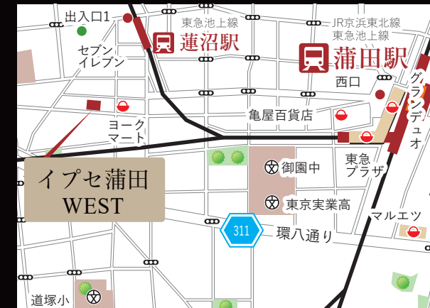
物件近隣にはスーパー「ヨークマート」有り。お買物にも至便な環境です。

【契約条件】 普通賃貸借2年契約 敷金1ヶ月 礼金0ヶ月 賃貸保証会社加入の事 貸主指定火災保険加入の事 鍵交換費用 27,500円 早期解約違約金有(1年未満1ヶ月) ※1 2月末日までのご成約者様対象