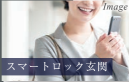
スマートロック玄関

スマホひとつで玄関錠の開・施錠ができる「スマートロック」システムを採用した玄関ドア。鍵を持ち運ぶ必要や複製する必要もなく、鍵の紛失するリスクを削減することもできます。