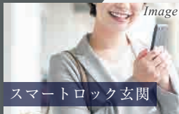
スマートロック玄関

スマホひとつで玄関錠の開・施錠ができる「スマートロック」システムを採用した玄関ドア。鍵を持ち運ぶ必要や複製する必要もなく、鍵の紛失するリスクを削減することもできます。