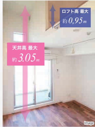
ロフト=はしこではなく『階段』仕様なので、戸建てのメゾネット感覚が味わえます。スペースや戸建て分譲を求めるカップル、新婚さんにもおすすめです。