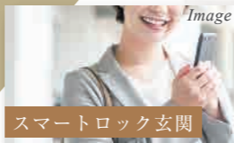
スマートロック玄関

Image スマホひとつで玄関錠の開・施錠のできる「スマートロック」システムを採用した玄関ドア。鍵を持ち運ぶ必要や複製する必要もなく、鍵の紛失するリスクを削減することもできます。