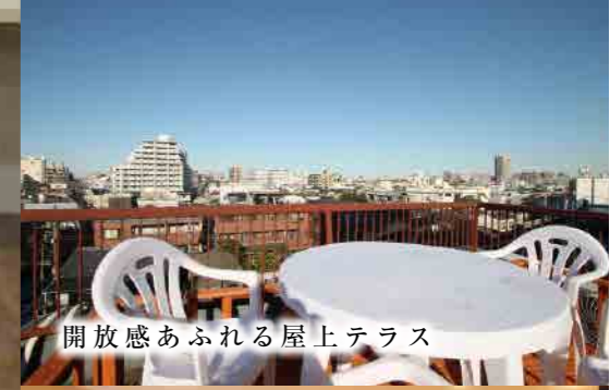
開放感あふれる屋上テラス