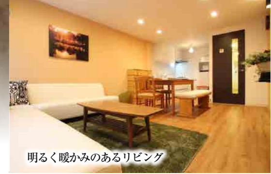
明るく暖かみのあるリビング