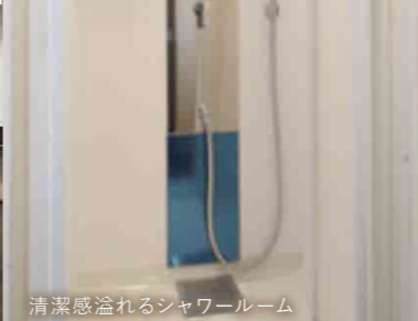
清潔感溢れるシャワールーム