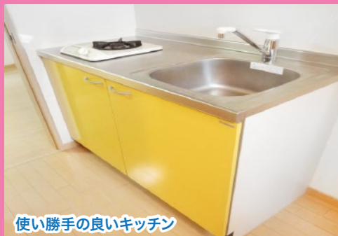
使い勝手の良いキッチン