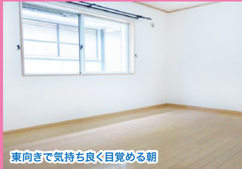
東向きで気持ち良く目覚める朝