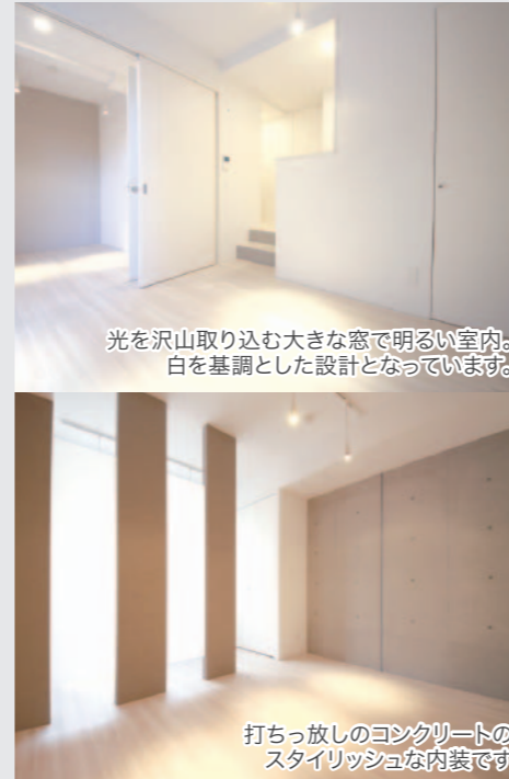
光を沢山取り込む大きな窓で明るい室内。白を基調とした設計となっています。

LDKのお部屋は、何といても広くてのんびり過ごせるのが最大のメリット!家具の自由度も高く、インテリア選びも楽しめるのがポイント。キッチンとリビングの隔たりにないので、一体感が生まれるのも嬉しいところ。自分らしい空間づくりにおすすめのお部屋です。