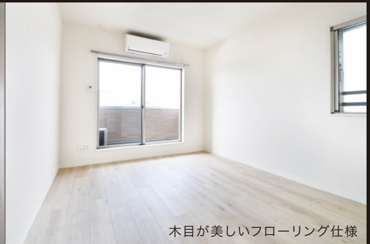
木目が美しいフローリング仕様