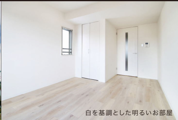
白を基調とした明るいお部屋